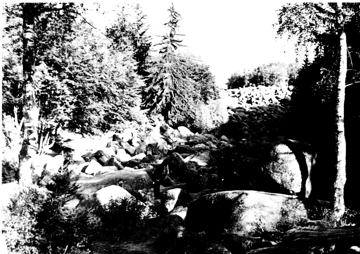
Východoevropský region prožívá období rozkvětu chráněných území. Jedním z nejstarších národních parků je Vitoša nad Sofií v Bulharsku (na snímku balvanité proudy ve vrcholových partiích); má však v současné době problémy s návštěvností.

takových, které přesahují státní hranice i hranice vlastního regionu (např. povodí velkých řek, zejména Dunaje, oblast Baltického moře aj.).