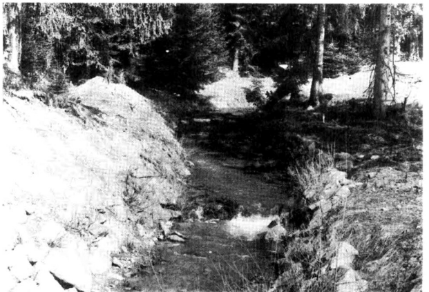
Oživená kamenná rovinanina v extraviláne