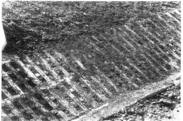
Betónové prefabrikáty možno oživiť vhodnými vegetačnými prvkami (zatrávniť, vysadiť vrbovými odrezkami a pod.)