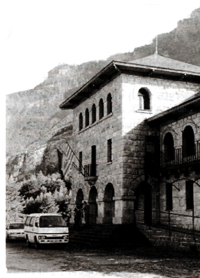
Informačné stredisko v Národnom parku Ordesa a Monte Perdido pri mestečku Torla