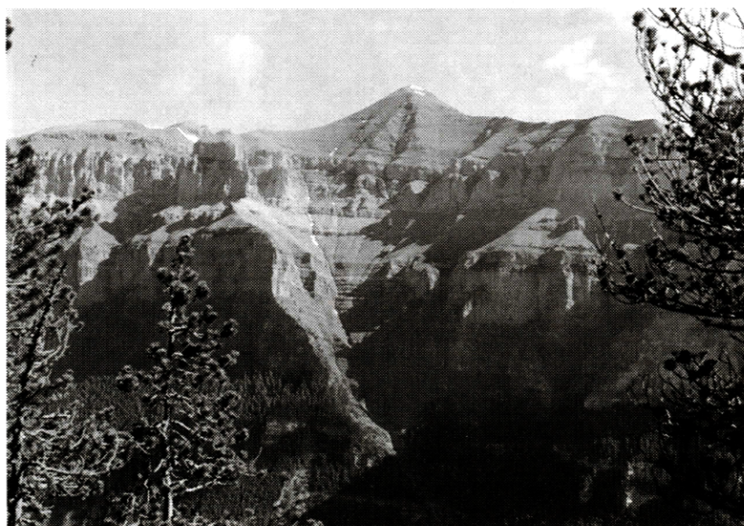
Národný park Ordesa a Monte Perdido (v severovýchodnom Španielsku)