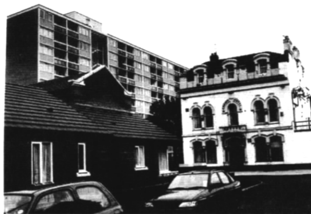
2. Hulme: 3 generácie architektúry – pôvodný objekt, "panelákový agresor" a víťazná retrotradícia

jednotlivých kategórií prostredia je alebo demokratická, alebo likvidačná. Metóda veľkoplošných asanácií historických centier miest, či vidieckych sídel okolo mesta mala viesť ku "corbusierovským" víťazstvám (obr. 1 a 3. s. obálky). Postup sa niekedy obrátil do protismeru. Charles Jencks definoval okamih smrti modernej architektúry ako začiatok likvidácie sídliska Pruitt – Igoe v Saint Louis v USA. Aktuálnym príkladom je mestská časť Hulme v Manchestri. Po viacerých reparačných pokusoch nakoniec panelákovú monokultúru zbúrali (we have dynamite it down) a nahradili sociálne a environmentálne prijateľnou štruktúrou ulíc s nízko-odlaznou radovou zástavbou, vnútornými dvormi a oživeným geniom loci anglickej tradície (obr. 2).