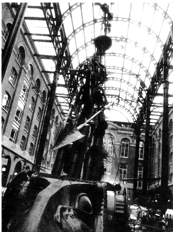
3. Zvyšovanie komunikatívneho mestského prostredia vo väčšej mierke – Londýn, Hay's Galleria

dernizmu všeobecne a funkcionalizmu v architektúre, práve pre svoje vyčleňovanie sa voči histórii priniesla rad kritických hodnotení, napr.: “Hlavný prúd modernej architektúry sa stal v priebehu rozvoja zovšeobecňujúcim hnutím. Podporoval program industrializácie a degradoval rôznosť typickú pre miestne vyjadrenie. V dôsledku toho rozmach modernej architektúry často ničil existujúcu mestskú zástavbu. Doslova decimoval všetko, čo stálo v ceste buldozéra, hlavnému nástroju moderného úsilia o “pokrok” (Jencks in Grenz, 1997).