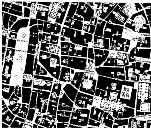
4. Giovanni Battista Nolli – mapa Ríma 1748 – fascinujúca interpretácia mestského prostredia z hľadiska jeho demokracie, alebo demoability verejnej prístupnosti a užívateľnosti bez ohľadu na podradnú kategorizáciu exteriér-interiér

Nolliho mapa Ríma (obr. 4) tieto skutočnosti nerieši, len ich interpretuje, ale je to inšpiratívna interpretácia.