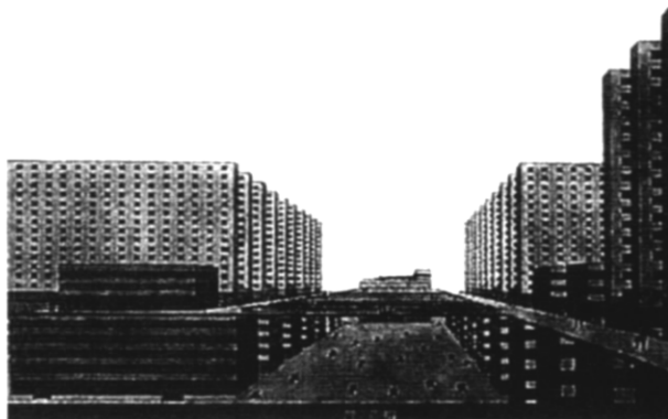
1. Ludwig Hilberseimer: vertikálne mesto, 1924. Ideové pozadie súčasných problémov – človek jednotlivec sa ocitol až na konci úvah.

Vývoj urbánnych systémov pri zjednodušenom pohľade môže byť kontinuálny alebo zlomový. Kompetícia