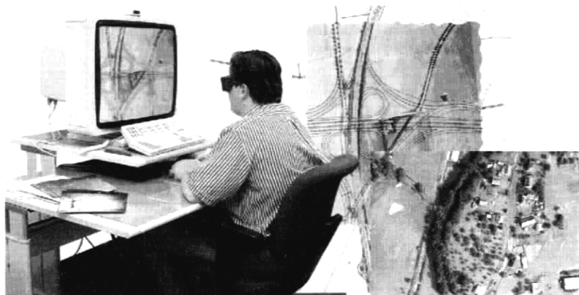
1. Fotogrametrické 3D mapovanie na digitálnej fotogrametrickej stanici Image Station

Väčšina GIS v súčasnosti pracuje s kombináciou mapových podkladov rôznej presnosti. Používa napr. vektorové údaje (len niektorých polohopisných prvkov)