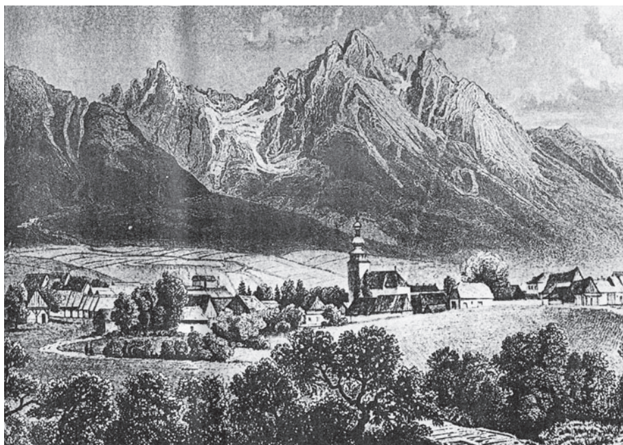
Panoráma Tatier z 19. storočia – krajina medzi Kežmarkom a dolnou hranicou lesa je už intenzívne zastavaná.

Ak majú byť východiskom urbanistickej tvorby komplexne spracované programy ochrany kultúrneho a historického dedičstva, treba vypracovať kritériá na ich analýzu na úrovni regiónu a obce. Zo skúseností pri spracovaní územnoplánovacích dokumentov, a najmä metodologických nástrojov, možno konkretizovať kritériá v polohe regionálnej i lokálnej (Berková, 2000).