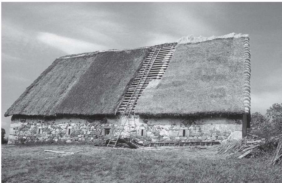
Charakteristický príklad súčasného stavu kultúrnohistorickej pamiatky slúžiacej na hospodárske účely.

územia, programov rozvoja regiónov a obcí a ďalších odvetvových projektov. Programy zabezpečujú a schvaľujú regionálne, mestské a obecné zastupiteľstvá ako súčasť širšie chápaného programu rozvoja svojho územia. Spája sa v nich záujem štátu a obcí v oblasti starostlivosti o kultúrne dedičstvo s cieľavedomou hospodárskou a sociálnou politikou sídel.