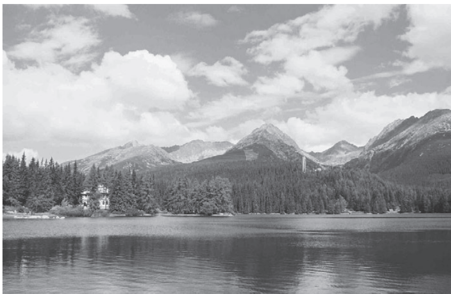
Panoráma Tatier v súčasnosti. Mikropriestor Štrbského plesa s radikálnymi zásahmi do krajiny.

Pre zachovanie kultúrneho dedičstva v krajine a v sídlach sa v procese schvaľovania záväznej časti územného plánu schvaľujú aj regulatívy a opatrenia na