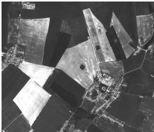
Obr. 2. Detekcia širokoriadkových plodín pomocou satelitnej scény. Zdroj: Quickbird Topo Red, 12. 6. 2006

Analógovo (vizuálne) sa interpretoval satelitný obrazový záznam územia Trnavskej pahorkatiny. Satelitný obrazový záznam IRS Pan z r. 1999 má rozlišovaciu schopnosť 5 m, čo je relatívne vysoká presnosť. Pomocné údaje na posúdenie a zaradenie skúmaných plôch medzi