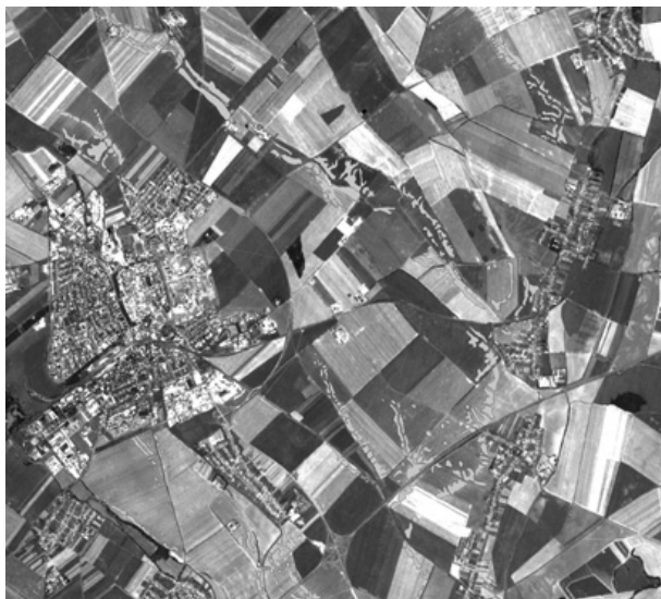
Obr. 3. Identifikované areály erodovanej pôdy na Trnavskej pahorkatine.

uspokojivé výsledky. Na štandardizáciu a hodnotenie parametrov pôdneho krytu treba analyzovať a porovnávať satelitné obrazové záznamy z rôznych období a hodnotiť vplyv využívania a manažmentu pôdy na dynamiku jej parametrov slúžiacich ako referenčné charakteristiky.