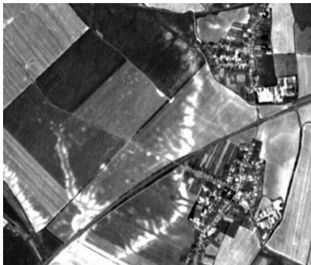
Obr. 1. Detekcia rozsahu erózie pôdy v lokalite Zeleneč.

podstatne zložitejšia. S metódami DPZ sa uvažuje pri zisťovaní nasledujúcich pôdnych parametrov a vlastností pôdy: zrnitosť, vlhkosť, obsah pôdnej organickej hmoty, salinita, drsnosť povrchu. Okrem toho, satelitné snímky sú vo viacerých prípadoch pomôckou pri mapovaní pôdy, resp. pôdnych typov v krajine.