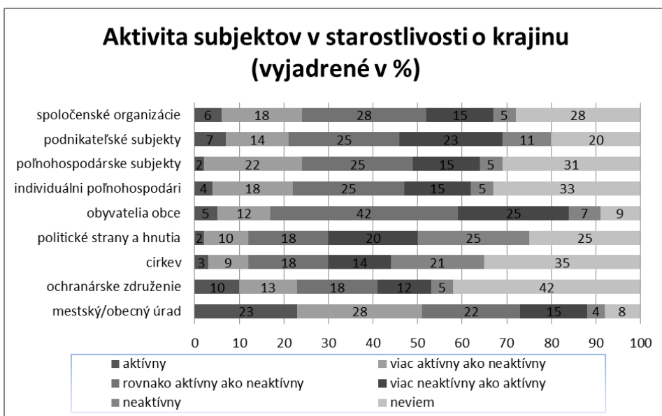
Tab. 1: Zapojenie uvedených subjektov do starostlivosti o krajinu v okrese Skalica

Na to aby daný región prosperoval a rozvíjal sa potrebujeme v riešenom území dostatok aktívnych občanov, organizácií a subjektov. Hodnotenia aktivity uvedených subjektov a organizácií v starostlivosti o krajinu obce/regiónu uvádzame pre lepšiu prehľadnosť v nasledujúcej tabuľke.